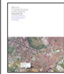
Malofiej 16 [2009]